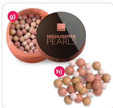
Perlas efecto bronceador 28 g