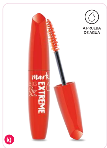
k) 191231 - Big & Extreme Mascara de volumen y longitud para pestañas 10 g