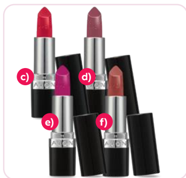
Lápiz labial 3,6 g