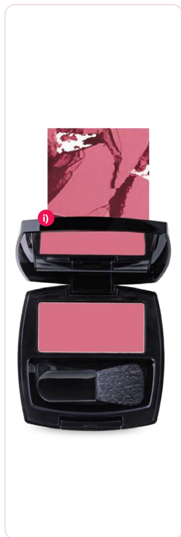
i) 191279 - Rubor en polvo facial Rose Luster 6,2 g