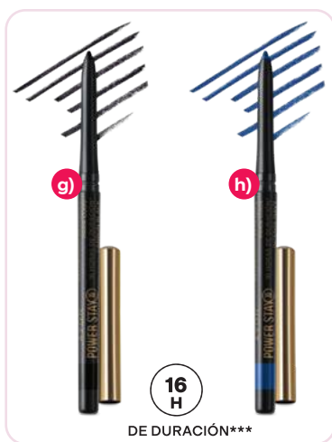
Power Stay Delineador retráctil para ojos 16 horas de duración*** 0,35 g