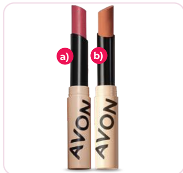
Bálsamo labial con color 1,5 g