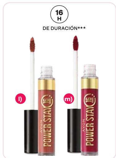
Power Stay Labial líquido 6 ml