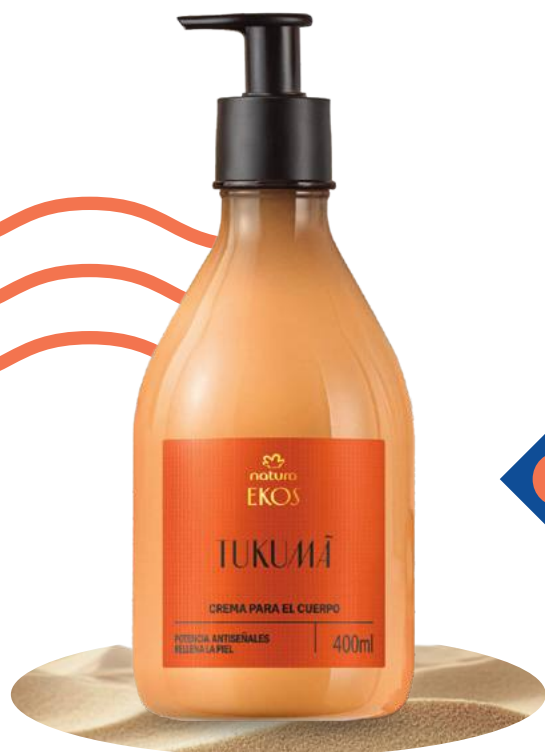
Ekos Pulpa hidratante corporal tukumã 400 ml

Consultores de Belleza nivel Bronce o Plata: ingresa pedido en ciclo 10 u 11 y elige uno de estos regalos: