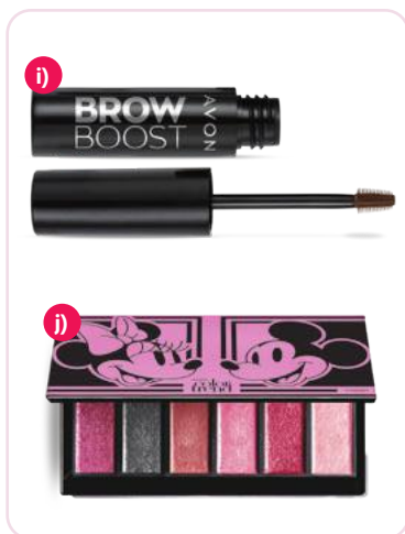
i) 191190 - Brow boost Gel para cejas dark brown 3,3 g