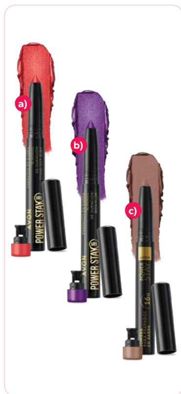
Sombra para párpados en barra 16 horas de duración*** 1,4 g